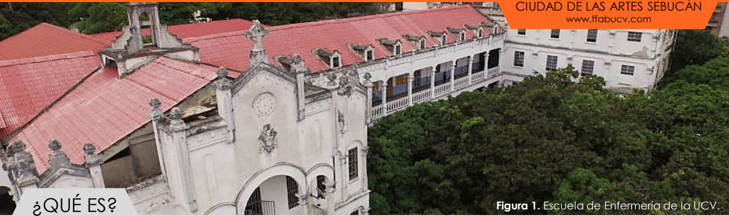
Figura 1. Escuela de Enfermería de la UCV.