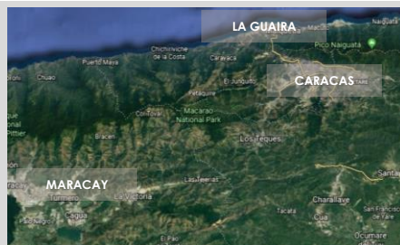
Figura 3. Ciudades