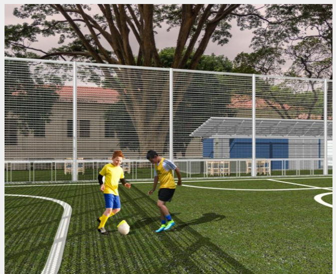
Figura 7. Área deportiva