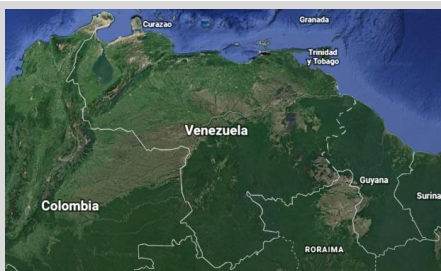
Figura 2. Venezuela

Se emplaza al norte de la ciudad de Caracas a 35 km del Aeropuerto Internacional Simón Bolívar y el Puerto de La Guaira. Un sector caracterizado por su accesibilidad y servicio de transporte público, reconocido por su paisaje, alto valor residencial y comercial, en una parcela de uso educacional y cultural.