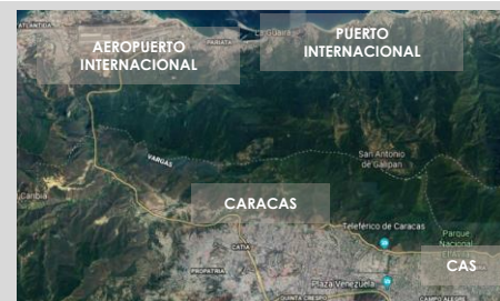
Figura 4. Accesos a Caracas